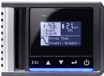
直覺化 LCD 顯示器，方便 配置和管理