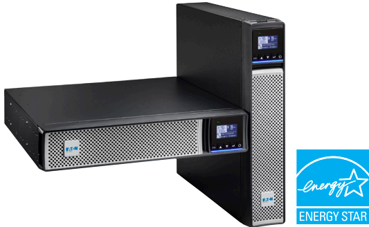
機架式/直立式多用途