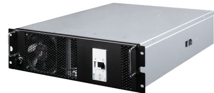
75kW 熱插拔 ATS