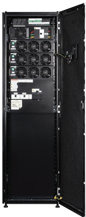
75kW 93PR Std