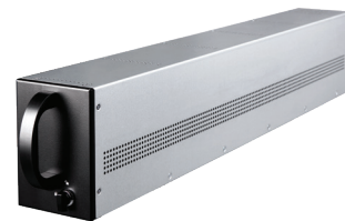
10*1234w VRLA 電池模組