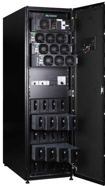
75kW 93PR VRLA